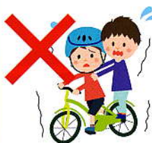
道交法第57条第2項 2万円以下の罰金等