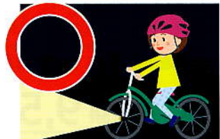
道交法第52条第1項 5万円以下の罰金