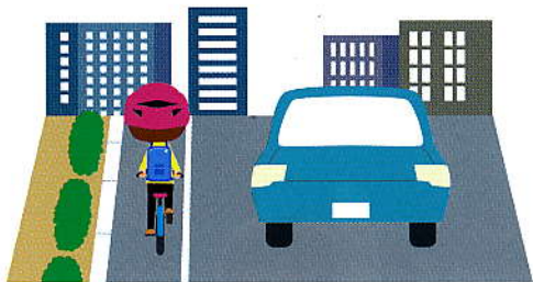
道交法第17条1項、4項、第18条1項 5万円以下の罰金等