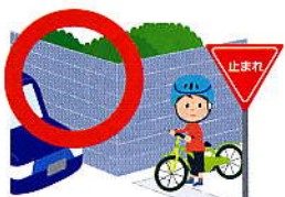
道交法第43条 5万円以下の罰金等