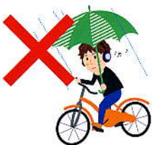
道交法第70条・71条 5万円以下の罰金等