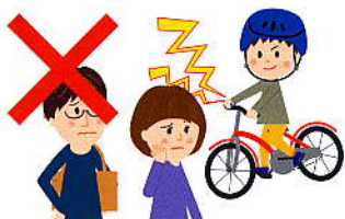
道交法第54条第2項 2万円以下の罰金等